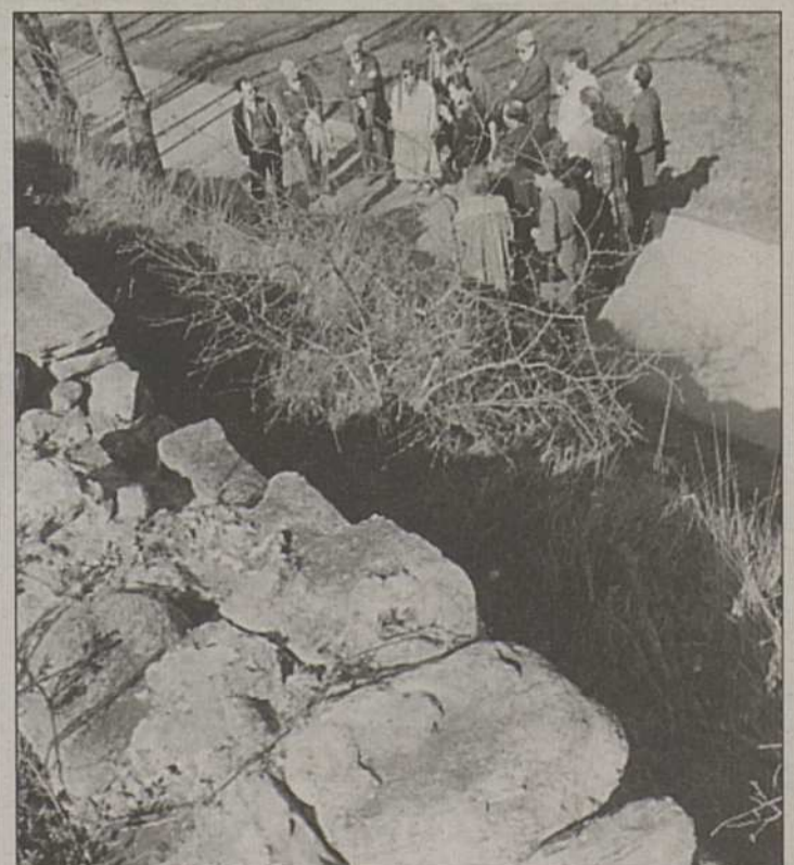
Eindrücklich nach einem halben Jahrtausend erinnert die Letzimauer an ihren ursprünglich zugeordneten Zweck: Schutz gegen die Übergriffe der Savoyarden. Ursprünglich lag das Bodenniveau tiefer, die Mauer war rund 7 m hoch.