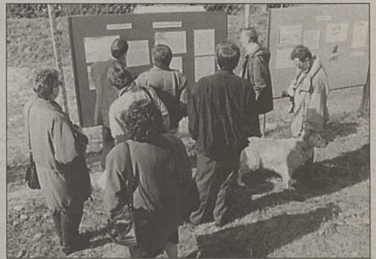
Am Info-Stand: Gut dokumentiert durch die «Pro Historia Glis».