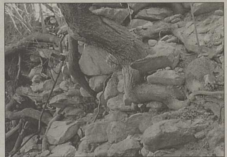
Der Zahn der Zeit, unterstützt vom Wurzelwerk der Bäume, nagt am Weiterbestand der Landmauer.