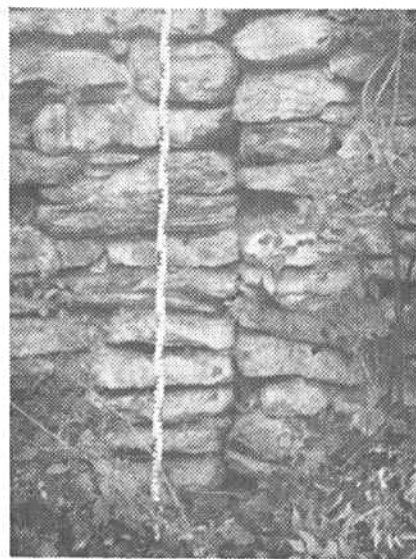
Naht an der Grossen Stöckenmauer. 1. Epoche 1686

beizutragen. Tat er das nicht, so konnte er es durch Geld ablösen, welches Geld denen geteilt wurde, welche zuviel gearbeitet hatten. Es war also eine Art Militärdienstpflichtersatz, bei dem jeder seine Pflicht zum Unterhalt der Stöckenmauern entweder durch «Stöckenwerk» (Gemeinwerk) oder durch Bezahlen ablösen konnte. Die Verwaltung besorgten die Stöckenvögte, welche sowohl die Aufsicht über die Arbeiter, wie die Mauern hatten und auch das Geld, wie ein Stück Boden, der der Geteilschaft gehörte, verwalten mussten. Stöckenvögte sind uns ab 1690 bekannt: