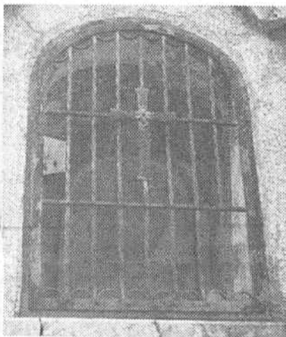
Sektor V, Bildstöcklein in der Kleinen Stöckenmauer. 2. Epoche 1757-64. Re-noviert 1855 und 1930.

Ein stummer Zeuge - die Stöckemauer - beginnt zu sprechen!