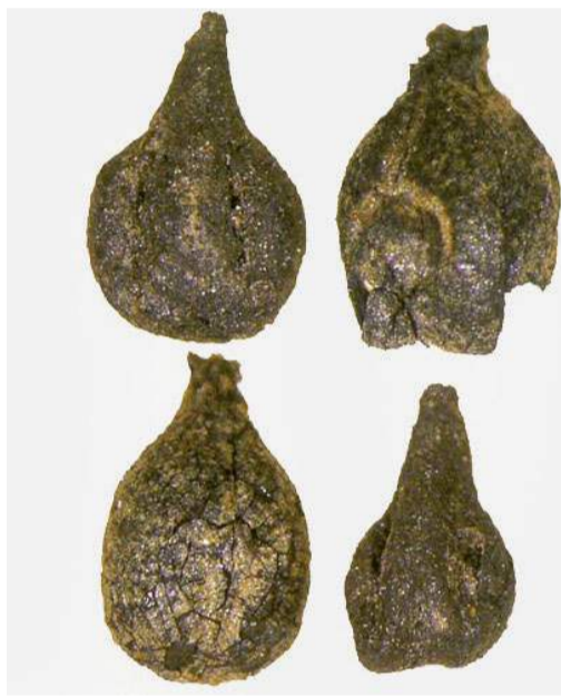
Traubenkerne. Aus eisenzeitlichen (oben) und aus römischen (unten) Schichten.

Römerzeit spricht für Weinpflanzen, die in unmittelbarer Nähe der Siedlung angebaut wurden. Diese Reste seien jedoch stark verkohlt, und so sei es schwierig, eine Verwandtschaft mit heute bekannten Rebsorten nachzuweisen.