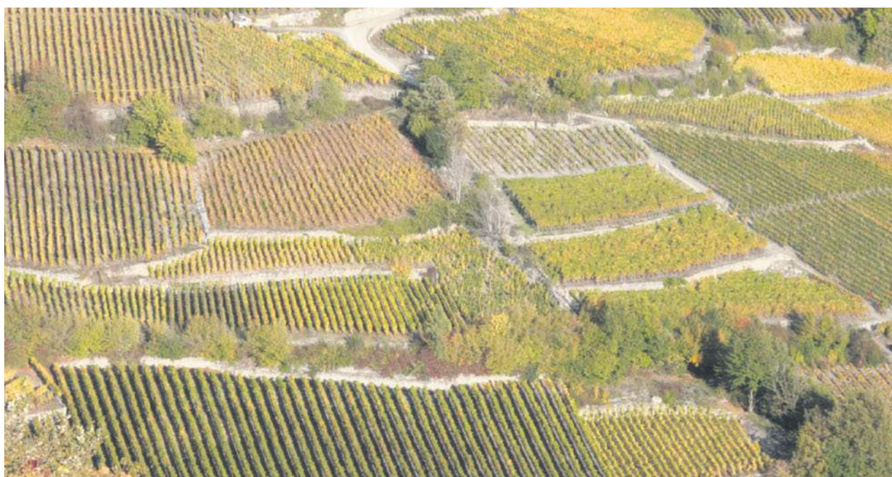
Goldener Teppich. Nur wenige spätherbstliche Tage sind uns gegönnt, um die Weinberge in ihrem goldenen Farbenspiel leuchten zu sehen. Das vorliegende aktuelle Bild zeigt sich im Weindorf Salgesch.

WALLIS | Das Wallis als grösster Weinbau-Kanton verfügt über eine rund 5236 Hektar umfassende Rebfläche und produziert etwa 40 Prozent des Schweizer Weins.