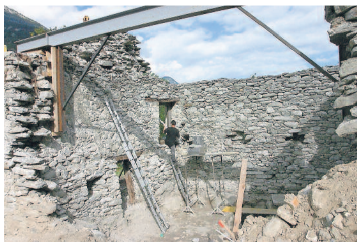
Das Gebäude an der Landmauer während der Sanierung.