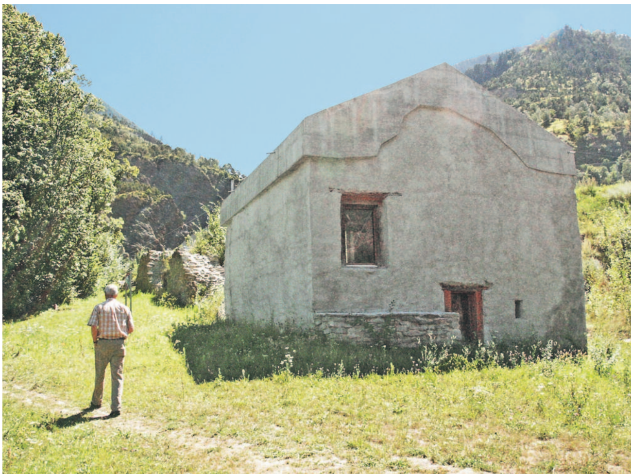
Der sanierte und etwas gewöhnungsbedürftige Bau an der Gamsamauer, am Weg zum Rohrberg. Ursprünglich soll das Gebäude, das letztlich als Stallscheune diente, als Suste und Kontrollpunkt seinen Zweck erfüllt haben. Als Info- und Ausstellungsraum kommt der alten und neu erstandenen Suste eine neue Aufgabe zu.