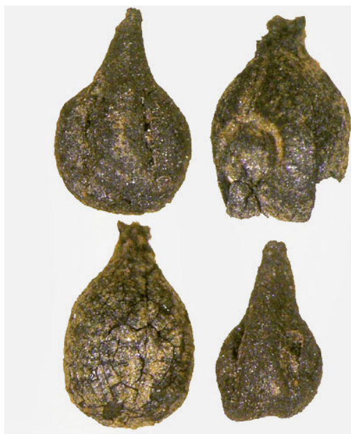
Traubenkerne. Aus eisenzeitlichen (oben) und aus römischen (unten) Schichten.

Römerzeit spricht für Weinpflanzen, die in unmittelbarer Nähe der Siedlung angebaut wurden. Diese Reste seien jedoch stark verkohlt, und so sei es schwierig, eine Verwandtschaft mit heute bekannten Rebsorten nachzuweisen.