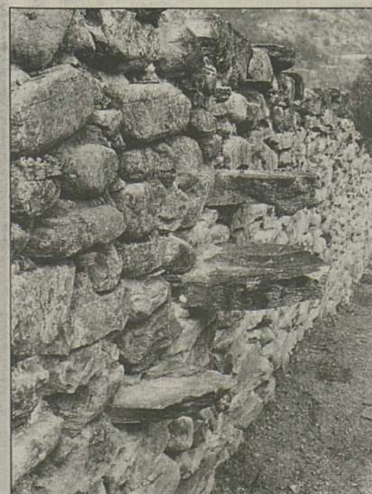
Ostseitig standen den Verteidigern die vorkragenden Steine als Treppen zur Verfügung.