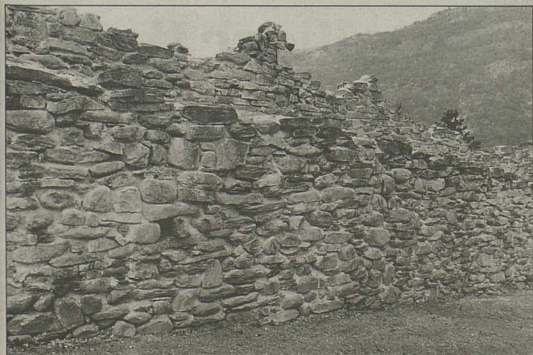
Das restaurierte Teilstück im südlichen Bereich. Dass die Landmauer gegen Westen gerichtet war, lässt sich aus dem Wehrgang hinter der einst zinnenbekrönten Brustwehr erkennen.

Herzlichen Dank für das Interview vor Ort, an der Landmauer von Gamsen! gtg