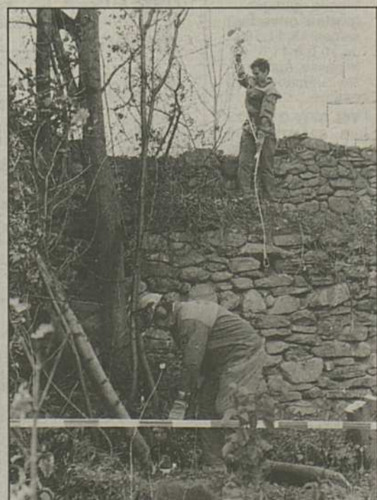
Zivilschutz in rettender Aktion: Abforsten als eine erste vordringliche Massnahme.