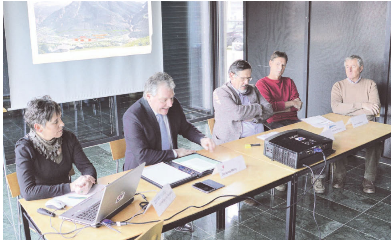
Mammutprojekt. Nach 25 Jahren Forschungsarbeit hält Staatsrat Jacques Melly (Zweiter von links) die Begrüssungsansprache zur Präsentation der Ergebnisse.

An der Fundstelle Gamsen wurde auf rund 15 000 Quadratmetern die Geschichte eines tief gelegenen Bergdorfs für die Bronze- und Römerzeit nachgezeichnet. Der Zeitraum umfasst das siebte vorchrist-