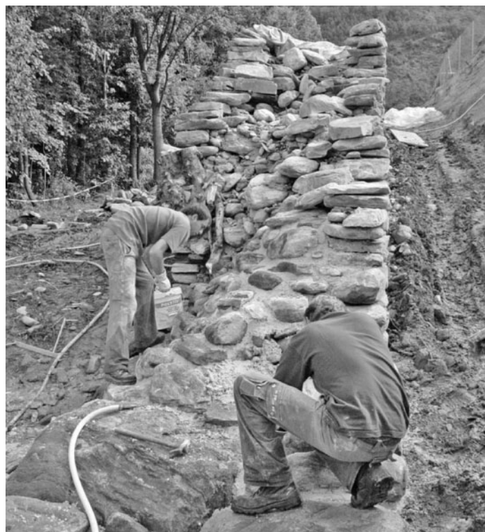
Restauration. Rund eine Million Franken sind in Erhalt und Restauration der Wehrmauer investiert worden.